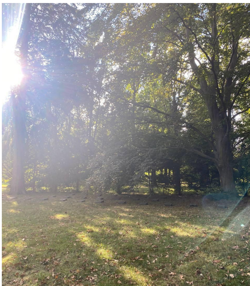
Nagrobki robotników przymusowych z Polski i byłego ZSRR na terenie Cmentarza Miejskiego w Görlitz.

Lista pochowanych osób w załączeniu (zał. 3)