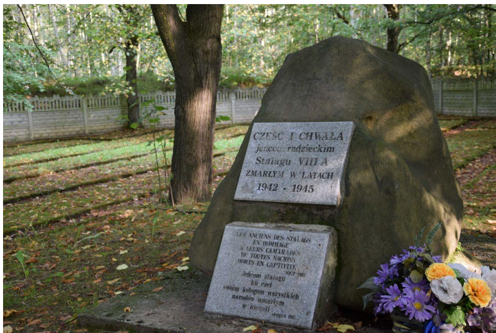
Cmentarz. Gład z tablicami.

Trzeba przy tym nadmienić, że od lat wiadomym jest, iż dokumentacja dotycząca spraw jenieckich Stalagu VIII A jest bardzo niekompletna. Najważniejsze dokumenty zabrano podczas ewakuacji obozu, która trwała od lutego do kwietnia 1945 r. – część z nich uważa się za zaginione, pozostałe przejęła i wywiozła Armia Czerwona. Dane dotyczące jeńców wojennych (Wydział Jeńców Obcych) przechowywane podczas wojny w Biurze Informacji Wehrmachtu o Stratach Wojennych i Jeńcach Wojennych (tzw. WAST) zostały skonfiskowane i w 1945 r. przekazane USA i ZSRR.