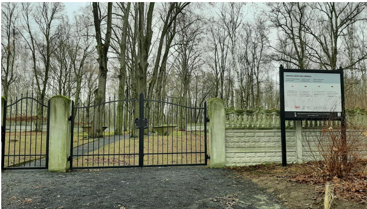
Cmentarz, nowa brama wejściowa z furtką.

W załączeniu plan schematyczny obozu (zał. 2)