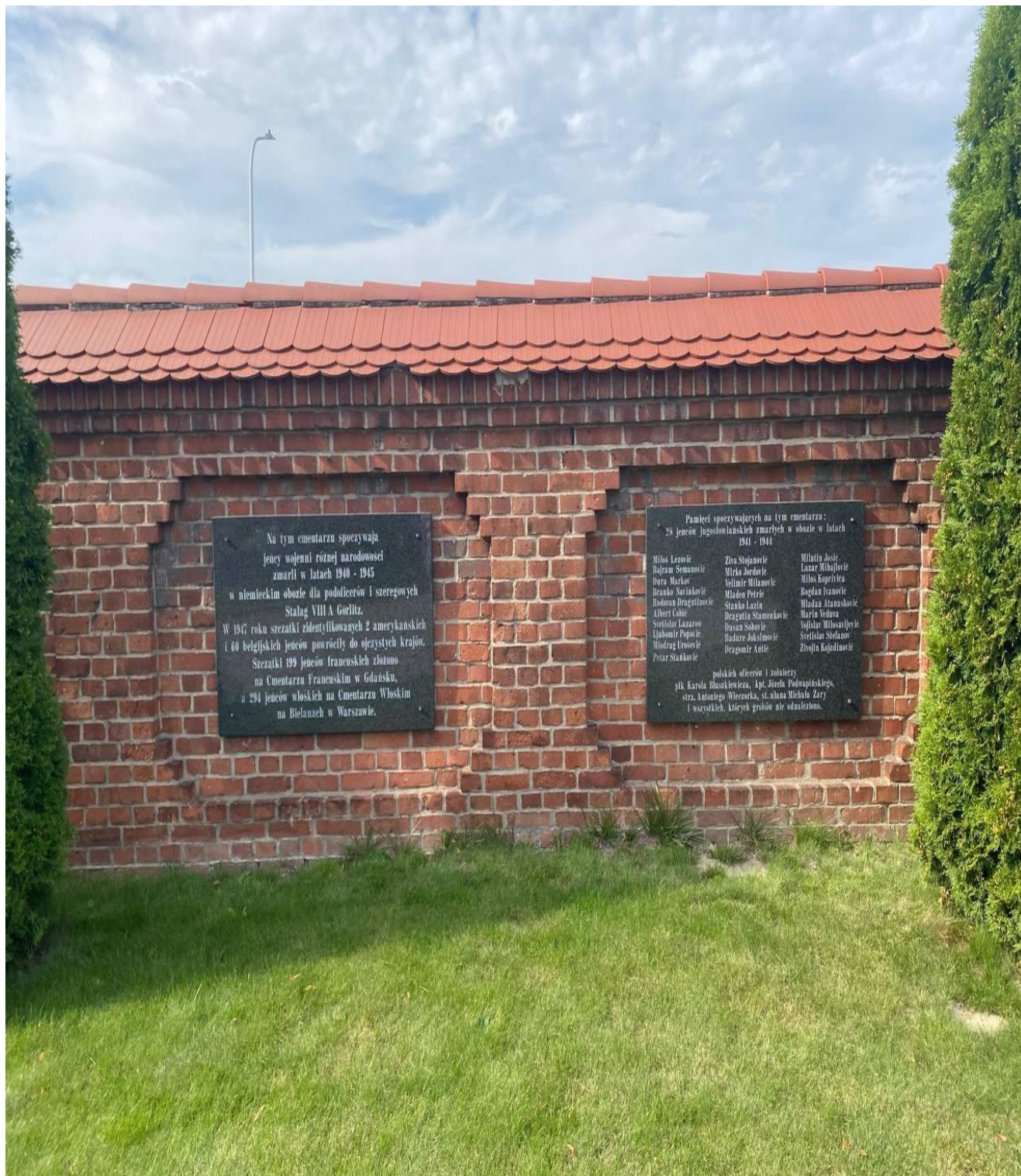
Po lewej stronie tablica pamiątkowa na murze cmentarnym przypominająca o pochowanych tu w latach 1940–1945 jeńcach wojennych różnych narodowości, ekshumowanych w 1947 r., po prawej tablica z nazwiskami jeńców jugosłowiańskich oraz kilku polskich oficerów i żołnierzy. Ta tablica jest także wyrazem pamięci dla tych, których grobów nie odnaleziono.