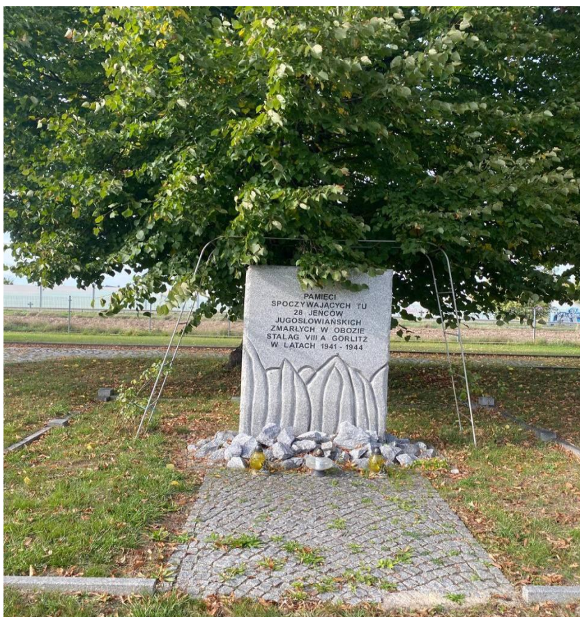
Pomnik poświęcony 28 jeńcom jugosłowiańskim zmarłym w Stalagu VIII A Görlitz w latach 1941–1944.

– 29.09. 2023 odwiedzono cmentarz przy ul. Cmentarnej 7a znajdujący się w Zgorzelcu, w części miasta Ujazd (d. Moys). Jest to dawna nekropolia ewangelicka, na której w czasie wojny grzebano zmarłych jeńców z pobliskiego Stalagu VIII A (Francuzów, Belgów, Włochów, Jugosłowian). Po wojnie część grobów ekshumowano, a szczątki przeniesiono na cmentarze wojenne w Polsce lub przewieziono do krajów ojczystych zmarłych. Zniszczony pod koniec lat 60. ubiegłego wieku cmentarz jest od paru lat rewitalizowany i podlega parafii Matki Bożej Łaskawej. Na tym cmentarzu pochowanych jest 28 jugosłowiańskich jeńców wojennych. Przypomina o nich pomnik postawiony przy kościele MB Łaskawej.